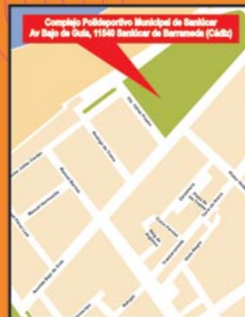
Mapa de situación de la Delegación de Juventud en Sanlúcar de Barrameda.